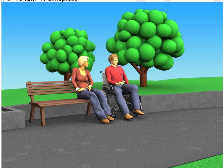
§ 8-4 Figur 4: Sitteplass

Der det anlegges sitteplasser langs veier eller i uteoppholdsareal må det i tillegg til benk eller stol avsettes et fritt areal slik at det er plass til rullestol. Arealet plasseres slik at bruk former en naturlig sittegruppe. Ved benker kan fritt areal plasseres ved siden av eller overfor benk. Arealet må sikre likestilt bruk. Plassering av areal i veibane er ikke tilstrekkelig.